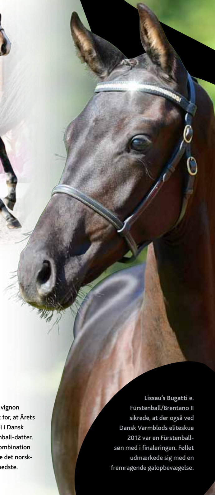
Lissau's Bugatti e. Fürstenball/Brentano II sikrede, at der også ved Dansk Varmblods eliteskue 2012 var en Fürstenball-søn med i finaleringen. Føllet udmærkede sig med en fremragende galopbevægelse.