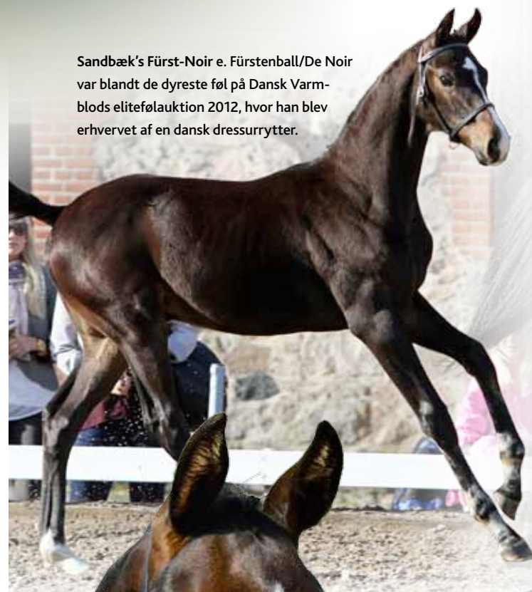
Sandbæk's Fürst-Noir e. Fürstenball/De Noir var blandt de dyreste føl på Dansk Varmblods elitefølauktion 2012, hvor han blev erhvervet af en dansk dressurrytter.

Follow Me e. Fürstenball/Donnerschwee tog sikkert fløjpladsen ved oldenburger-hingstekåringen i Vechta 2012, der var præget af en meget stærk top. Hingsten viste sig suverænt fra første dag og tog hurtigt plads i publikums hjerter som favorit til fløjpladsen. Igennem hele kåringsforløbet viste han sig som en kommende topatlet med meget kraftfulde og smidige gangarter karakteriseret af en stærk og hurtig motor.