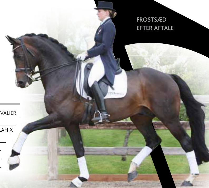
FROSTSÆD EFTER AFTALE